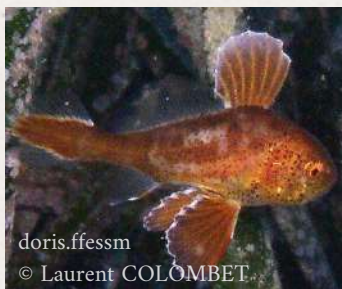
doris.ffessm © Laurent COLOMBET

Il giovanile è marrone-arancione con numerosi punti scuri. Dopo la fase larvale e fino a raggiungere i 4 cm, le sue pinne caudale e pelvica sono sovradimensionate rispetto al corpo.